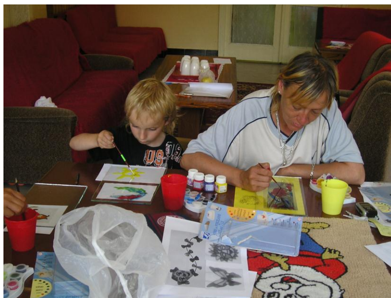
Tvorivé dielne – maľovanie na sklo

Činnosť neziskovej organizácie napriek obmedzenosti finančných zdrojov má rozširujúcu sa tendenciu s cieľom skvalitňovania poskytovaných sociálnych služieb a dodržiavania požiadaviek vyplývajúcich zo zákona o sociálnych službách. Prevádzka jednotlivých zariadení je zabezpečovaná s maximálnym úsilím racionalizovať a znižovať náklady – vid' graf porovnanie vývoja nákladov a výnosov za uplynulé obdobie.