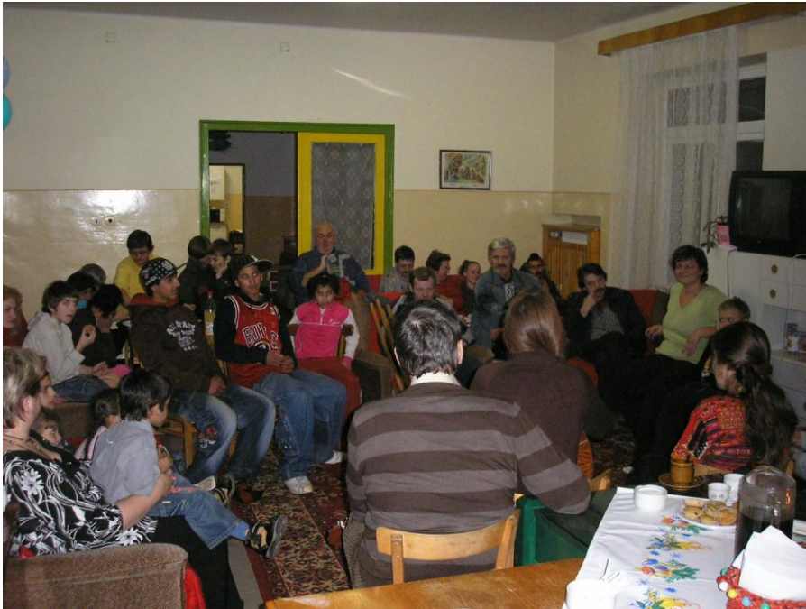
Adventné posedenie 7. 12. 2008

Vianočné obdobie sa nieslo v znamení šíriacej sa vône z kuchyne, mnohé z našich klientiek mali možnosť prvý raz si vyskúšať pečenie oplátok, pečenie vianočného pečiva či koláčov. No Vianoce sú aj obdobím, kedy sa zamýšľame nad životom a mnohí klienti prežívajú smútok zo straty domova, zo samoty – bez ohľadu či oň prišli vlastnou vinou alebo inak. Zamestnanci sú preto tí, ktorí im pomáhajú postaviť sa na vlastné nohy a vrátiť sa späť do bežného života.