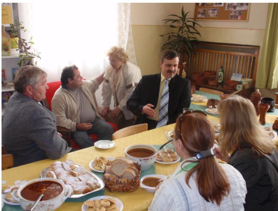
Deň otvorených dverí 6. 11. 2008 - diskusia hostí