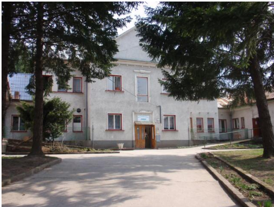
Sídlo neziskovej organizácie Jazmín

Chceme byť nadáciám a fundraiserom partnerom, do ktorého sa oplatí investovať.