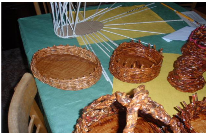
Ukážka prác našich klientov