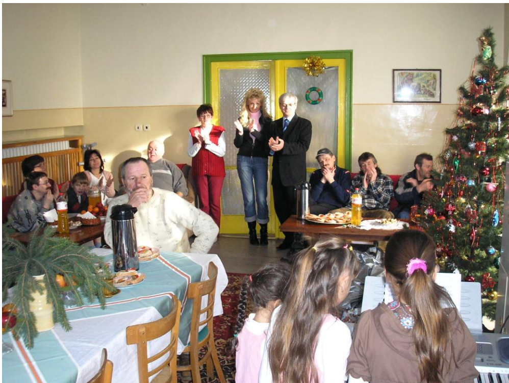
Vianočné posedenie s programom a odovzdávanie vianočných darčiekov

Vianočné obdobie sa nieslo v znamení šíriacej sa vône z kuchyne, mnohé z našich klientiek mali možnosť prvý raz si vyskúšať pečenie oplátok, pečenie vianočného pečiva či koláčov. No Vianoce sú aj obdobím, kedy sa zamýšľame nad životom a mnohí klienti prežívajú smútok zo straty domova, zo samoty – bez ohľadu či oň prišli vlastnou vinou alebo inak. Zamestnanci sú preto tí, ktorí im pomáhajú postaviť sa na vlastné nohy a vrátiť sa späť do bežného života.