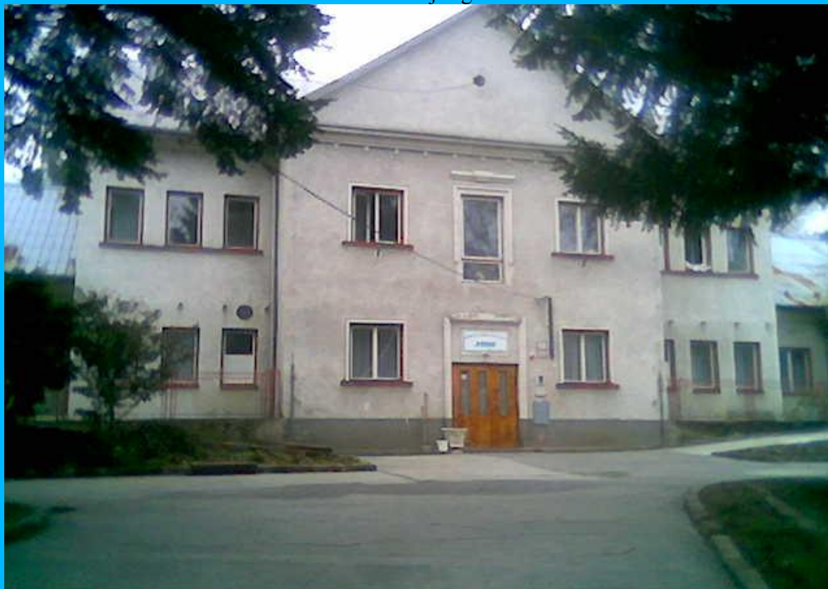
Pohľad na sídlo neziskovej organizácie a Dorku

Spolupracujeme aj s Trenčianskym samosprávnym krajom, s oddelením sociálnych služieb. Spoluprácu s TSK s oddelením sociálnych služieb môžeme tiež označiť prívlastkom veľmi dobrá. Pracovníci TSK sú ústretoví a odbornými radami nám pomáhajú pri zvyšovaní kvality poskytovania sociálnych služieb.