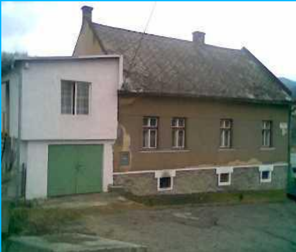
Pohľad na Humanitné centrum

Priemerný počet klientov v roku 2005 bol 14 a priemerná dĺžka pobytu bola 112 dní.